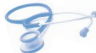
CÓDIGO: KI-810 MTCBL AZUL METÁLICO