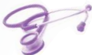
CÓDIGO: KI-810 PUR PÚRPURA