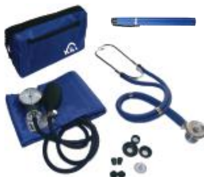
CÓDIGO : 700-BL (AZUL)