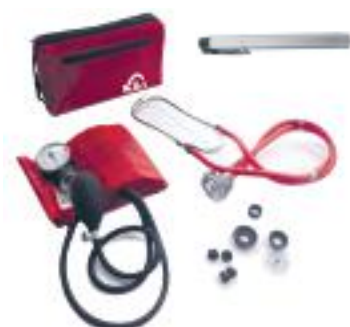
CÓDIGO : 700-R ( ROJO)

Incluye: Tensiómetro anerode de nylon, estetoscopio rappaport con kit de repuestos, linterna pupilar led y bolso de transporte