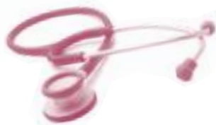
CÓDIGO: KI-810 BGY BORGONA

Estetoscopio de Aluminio con acabado satinado Pesa 3,5 onz Olivas suaves de silicon Anillos anti frio Incluye un diafragma y un par de olivas extra