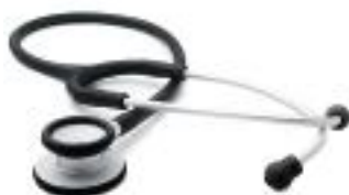
CÓDIGO: KI-810 BLK NEGRO