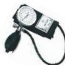
CÓDIGO: KI 815

Todos los manómetros K&I tienen garantía ilimitada de por vida.