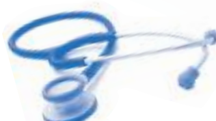
CÓDIGO: KI-810 RYBL AZUL ROYAL