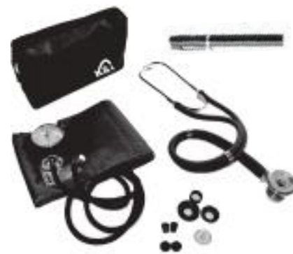
CÓDIGO : 700-BLK (NEGRO)