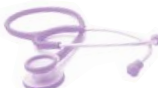
CÓDIGO: KI-810 FRPUR PÚRPURA TRASLUCIDO